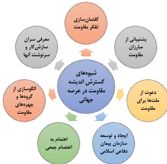
شکل ۲: شیوه‌های گسترش فکر مقاومت در جهان مبتنی بر دیدگاه آیت‌الله خامنه‌ای

یکی دیگر از نتایج اعتماد به حمایت آمریکا و دلخوش بودن به وعده‌های غرب، همان تحقیق‌ری بود که در دیدار دهم اسفندماه ۱۴۰۳ «دونالد ترامپ» رئیس جمهوری آمریکا و معاون او «جی دی ونس» با رئیس جمهوری اوکراین «ولودیمیر زلنسکی» در کاخ سفید در مقابل رسانه‌های جهان در کاخ سفید اتفاق افتاد. در این دیدار، رئیس جمهوری آمریکا بارها بر سر زلنسکی فریاد زد و سپس او را تهدید کرد و حتی مقامات آمریکایی (تا زمان تدوین این مقاله) در پی کنار گذاشتن زلنسکی از قدرت هستند ( https://www.mehrnews.com ). رئیس جمهوری اوکراین که با حمایت غرب و آمریکا و وعده پیوستن به ناتو درگیر جنگی ویرانگر و خانمان‌سوز با روسیه شد، علاوه بر تلفات فراوان و خسارات بی‌شماری که در این جنگ متحمل شد، اکنون با روی کار آمدن «دونالد ترامپ» حمایت آمریکا را از دست داد و مورد تحقیر گرفت. آیت‌الله خامنه‌ای، در سه سال گذشته به کشورهایی که پشت‌گرمی آن‌ها به آمریکا است، در بیان عبرت‌های مهم از قضایای اوکراین، هشدار داده بودند: «پشتیبانی قدرت‌های غربی از کشورها و دولت‌هایی که دست‌نشانده آن‌ها هستند، یک سراب است، واقعیت ندارد؛ این را همه دولت‌ها بدانند. آن دولت‌هایی که پشت‌گرمی آمریکا و به اروپا است، ببینند وضع امروز اوکراین و دیروز افغانستان را» (خامنه‌ای، بیانات: ۱۴۰۰/۱۲/۱۰).