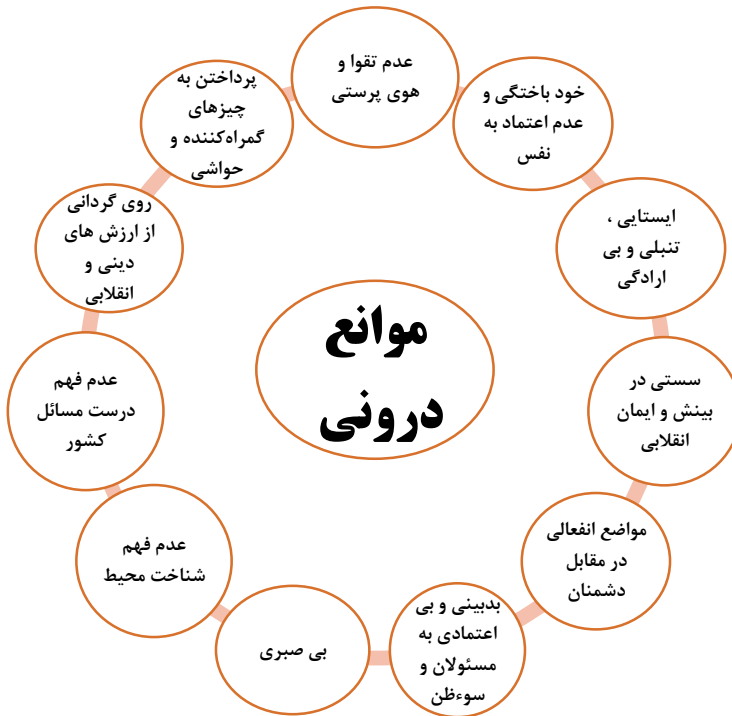
شکل شماره ۱: موانع درونی تحقق دولت اسلامی