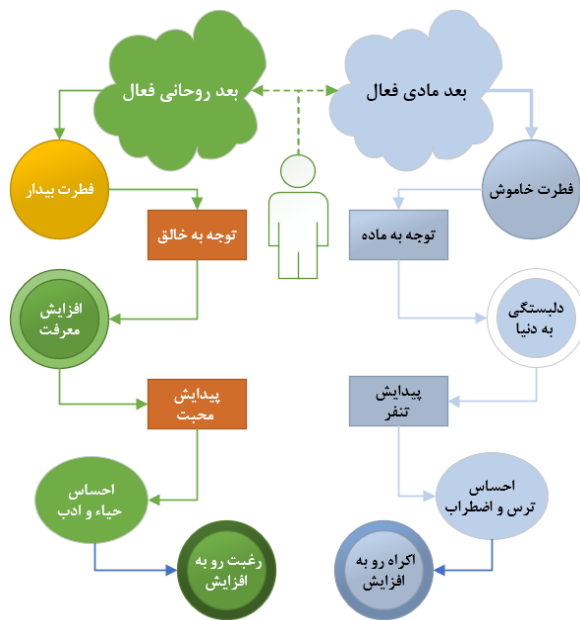
شکل ۱: فرایند ایجاد رغبت یا اکراه در وجود

و روایات، همچنین در بیانات مقام معظم رهبری پیرامون نقش عاطفه در پذیرش دین و نقش گرایش در دین‌داری و اینکه این مسئله یکی از مباحث بنیادی انسان است که امتداد اجتماعی مهمی دارد؛ در این مقاله این موضوع را مورد بررسی قرار می‌دهیم. از آنجا که «دگرگون کردن و متحول ساختن آدمی، بدون داشتن تصویر و توصیفی از او میسر نیست، از این‌رو در هر نظام تربیتی، توصیف انسان به‌منزلهٔ سنگ بنای آن است» (باقری، ۱۴۰۱، ص ۱۵)، لازم است ابتدا با نظر به آیات قرآن کریم و روایات معتبر نقل‌شده از معصومین (علیهم‌السلام) و همچنین منویات رهبری، توصیفی از فرایند ایجاد رغبت یا اکراه در وجود انسان طبق «شکل ۱» در جهت رسیدن به یک بینش اسلامی در این خصوص ارائه دهیم.