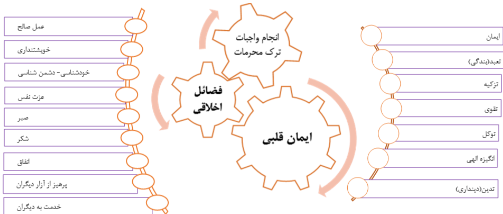
شکل ۲- تقسیم‌بندی نیازهای تربیتی

همچنین بر اساس جدول نیازهای تربیتی (جدول شماره ۴) و بر اساس بیانات رهبر معظم انقلاب (مدظله‌العالی) سه عنصر و نیاز اصلی تربیتی انسان، انجام واجبات و ترک محرمات (مسیر حرکت)، ایمان قلبی (موتور حرکت) و فضائل اخلاقی (آذوقه راه) می‌باشند. بر اساس این مبنا تقسیم‌بندی نیازهای تربیتی در شکل شماره (۲) نشان داده شده است: